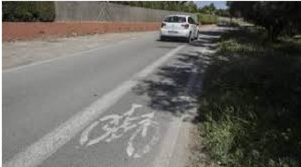
En Murcia, a 1 de Noviembre de 2018