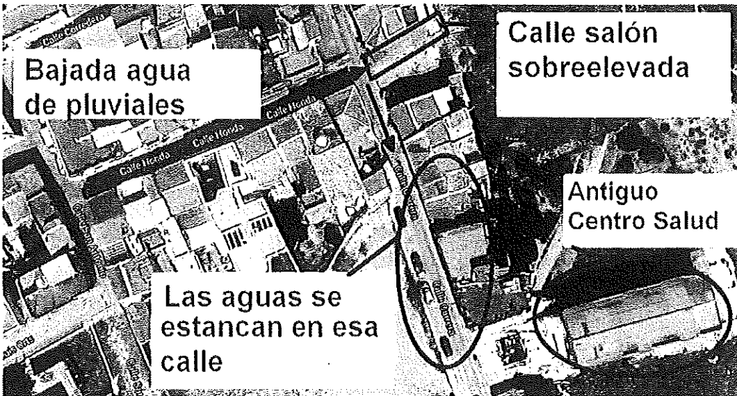
Bajada agua de pluviales