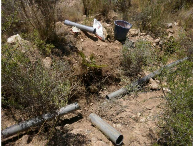
Arreglo de roturas en la tubería principal

Arreglos de tubería principal de la finca. Se arreglan dos roturas de la tubería principal que lleva el agua desde el aljibe hasta la casa debido a la importancia del buen estado de esta tubería para poder tener diferentes puntos de recogida de agua en la finca para los riegos de mantenimiento de las repoblaciones.