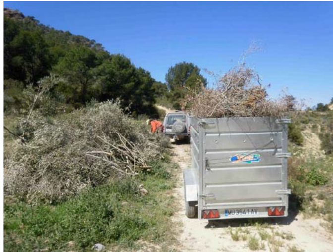
Retirada de poda de olivo para aprovechamiento de ganado caprino.