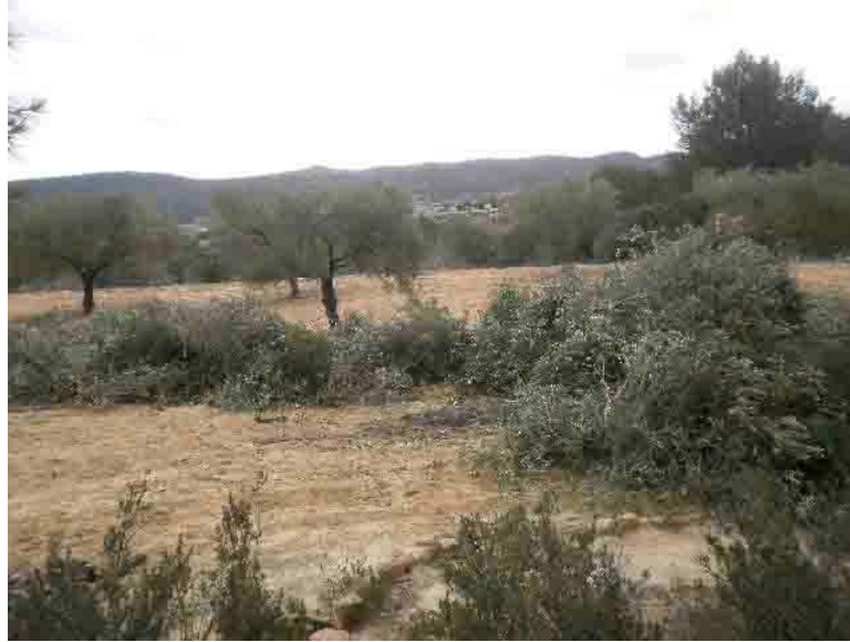
Olivos podados y leña preparada para la quema

Recogida y apilado de poda de olivos. Se recogen y apilan todas las ramas resultantes de la poda, trasladándolas a los sitios elegidos para la quema.