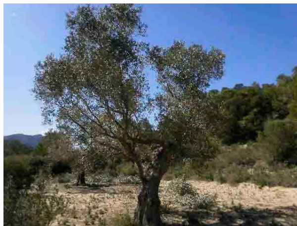
Olivo con exceso de leña antes de la poda

Poda de cultivar de olivos. La poda efectuada es de formación. Se eligen las ramas definitivas entre las que se dejaron en el clareo anterior para crear la estructura del árbol tratando de formarlos con dos ramas principales que bifurquen en tres secundarias o tres ramas principales que bifurque en dos secundarias. Se eliminan las varas basales y de la copa que emergieron como respuesta a la anterior poda donde se quitó mucha vegetación, debido al abandono de este cultivar durante muchos años.