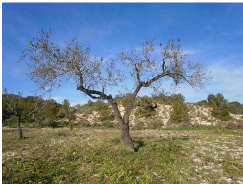
Almendo tras la poda realizada