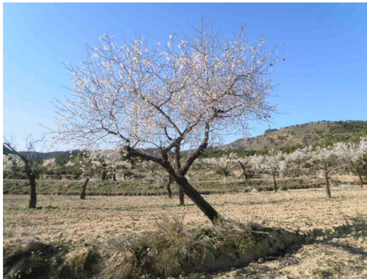
Almendo antes de la poda

Poda del cultivar de almendros. Se realiza una poda de rejuvenecimiento complementaria a las anteriores. Eliminando el exceso de madera vieja en deplorable estado sanitario, en aquellos lugares del árbol donde existe un renuevo idóneo para poder suplir con una nueva rama. Se rebaja de altura la copa del árbol y se iguala la altura de la misma.