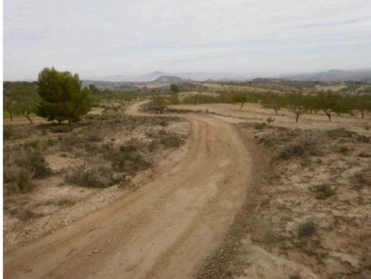
Camino interior de la finca recién trajillado

Trajillado. Se trajilla todo el camino principal de la finca quedándose tapadas todas las cárcavas producidas por las lluvias recientes.