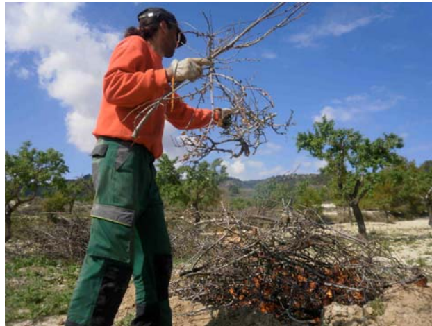
Quema de almendro

Poda de algarrobos y olivos plantados en el año 2010. Se realiza una poda de formación de ramas principales tras el pinzado del anterior año. Se embadurnan los troncos y ramas con arcilla y ceniza para cicatrizar las heridas causadas por los roedores.