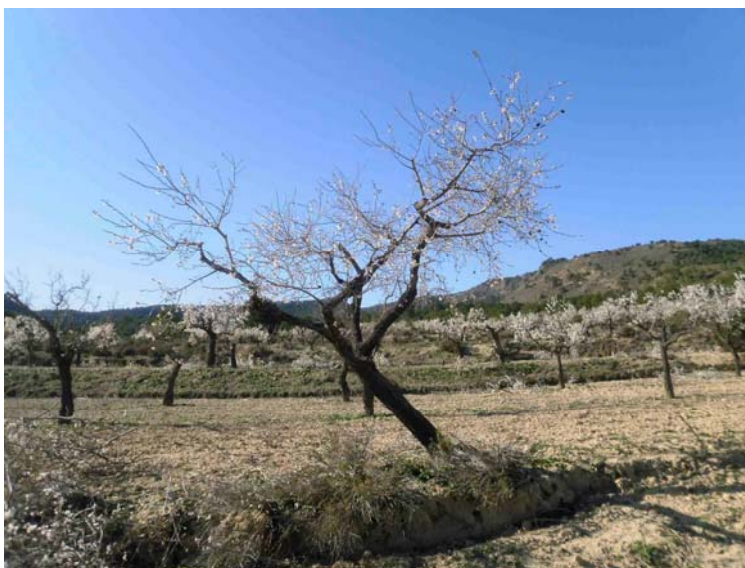
Almendo tras la poda