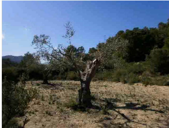
Varas seleccionadas para su posterior recorte en altura

Saca de poda de olivo al camino principal. Se sacan las ramas resultantes de la poda al camino principal para proceder a su troceo y posterior eliminación.