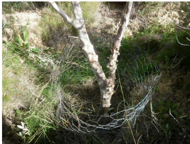
Rebrotos basales eliminados