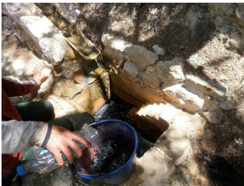
Limpieza de arqueta

Limpieza de infraestructura hidráulica. Se efectúa la limpieza de canaleta de bajada de agua a las balsas, limpieza de arquetas y se purga todo el tramo de tubería que conecta las balsas de anfibios.