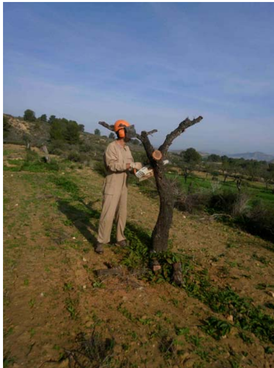
Eliminación de almendros muertos

Corte de almendros muertos. Se apean pies de almendros secos para evitar la proliferación de taladradores de la madera.