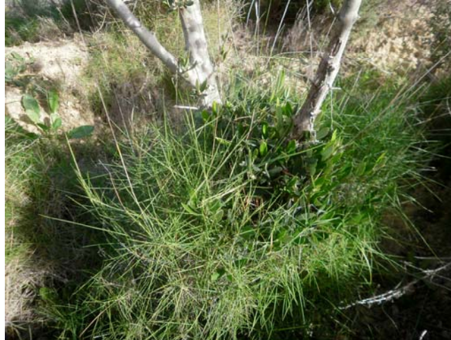
Rebrotos basales de olivo

Poda de olivos. Comienza la poda anual del olivar. Se cortan renuevos basales y renuevos de la zona aérea. El olivar ya está formado por lo que tan solo se realiza un igualado de altura de las ramas principales y corte de alguna rama sobrante.