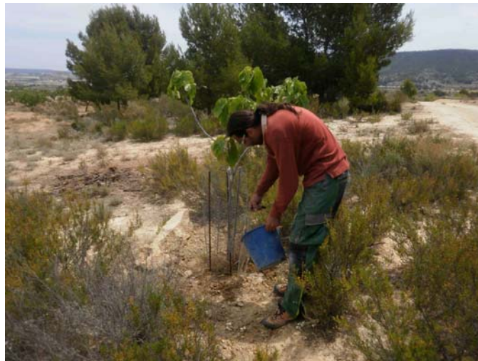
Riego de apoyo

Riego de algarrobos, olivos e higueras. Riego de apoyo al nuevo cultivar para asegurar su permanencia debido a las escasas lluvias de este año.