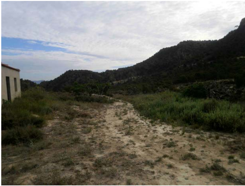
Alrededores de la casa antes del desbrozado