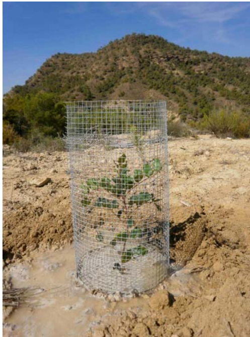
Algarrobo recién plantado

Riego de apoyo a las repoblaciones de planta autóctona del año 2010. Se realiza un riego de apoyo a la repoblación implantada en el año 2010, debido a la escasez de lluvias como medida para evitar marras en la época estival.