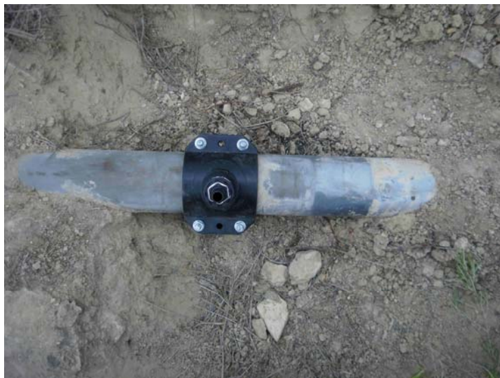
Toma de agua

Tomas de riego de la tubería principal. Se hace una toma de agua en la cercanía de la casa y otra en el camino principal para tener la posibilidad de abastecimiento de agua en dos puntos de la finca distanciados entre si, para riegos de apoyo.