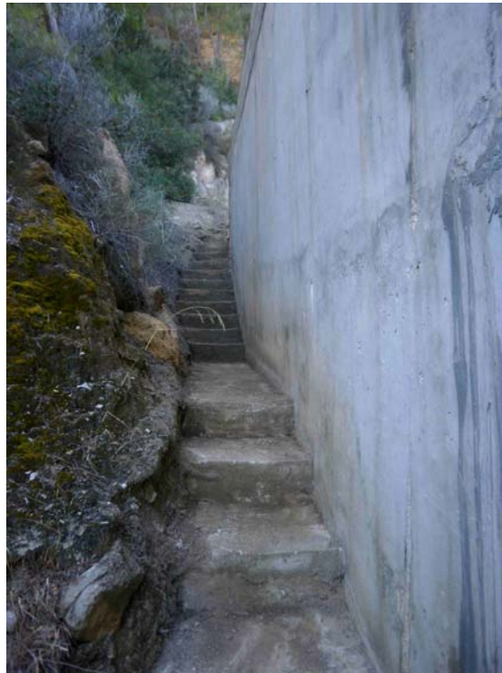
Escaleras de acceso que conducen a la bocamina al nacimiento de agua limpias de tierra acumulada por las lluvias.

Reposición de planta autóctona de mayo. Se reponen acebuches y lentiscos muertos de la plantación realizada en mayo de este año.