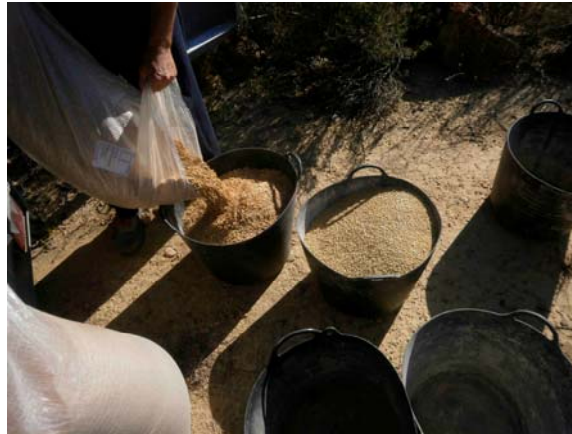
Mezclando el trigo, la avena y la cebada

Siembra de cereal. Se siembra casi la mitad de la superficie total agrícola de la finca con trigo, cebada y avena rubia. Se realiza una siembra densa para asegurar la nacencia del grano. Se siembra en dos puntos de la finca distantes entre si.