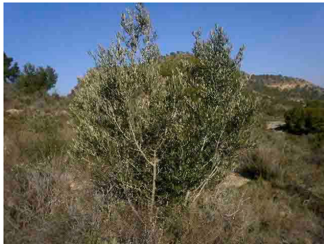
Parte aérea con exceso de ramificación