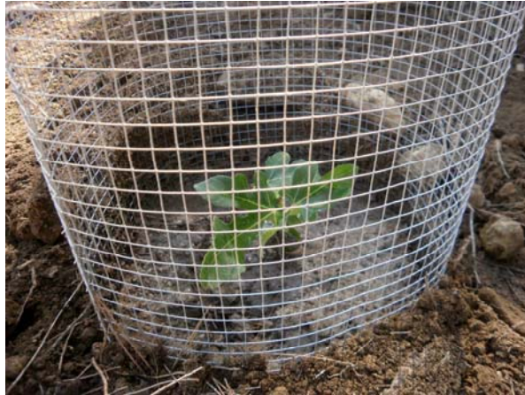
Higuera recién plantada

Riego de repoblación de planta autóctona plantada este año.