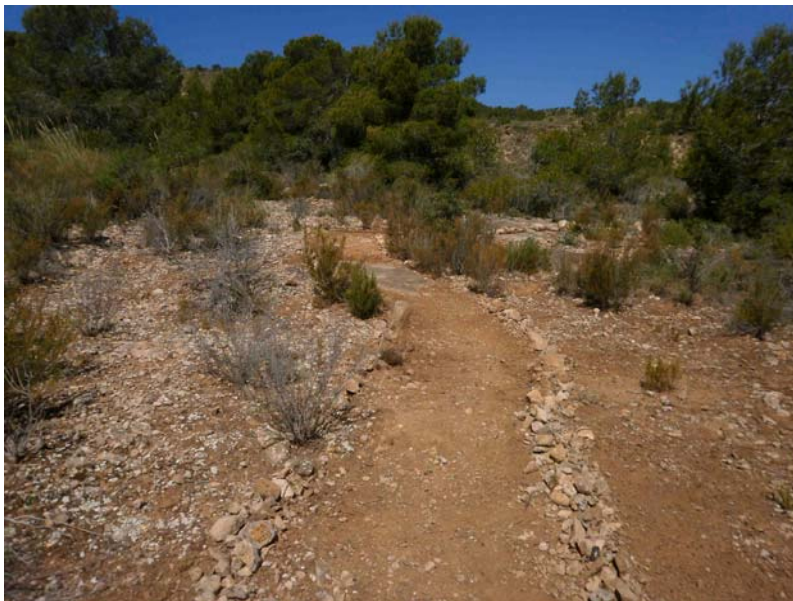
Tramo de senda tras ser marcado su límite