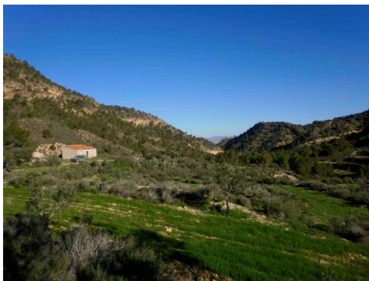
Cereal en pleno desarrollo

Siembra de cereal. Se siembra un tercio de la superficie agrícola de la finca con trigo, cebada y avena rubia. Se realiza una siembra densa para asegurar la nacencia del grano. Se realiza en varios puntos de la finca con el fin de repartir el alimento para la fauna.