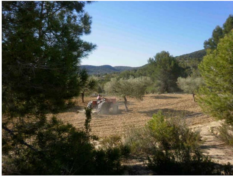
Labranza con cultivador

Riego de algarrobos, olivos e higueras. Riego de apoyo al nuevo cultivar para asegurar su permanencia debido a las escasas lluvias de este año.