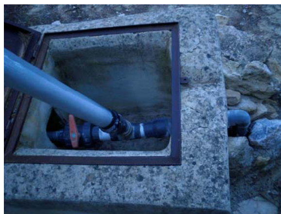
Disposición actual del cuadro general de riego

Arreglo llaves de riego y tubería rota. Se desmontan las llaves principales de salida de agua del aljibe para su limpieza y se abre la obra de la arqueta para poder proceder al cambio de lugar de la tubería que sirve como sifón de salida de aire. Mas adelante se cerrara la obra.