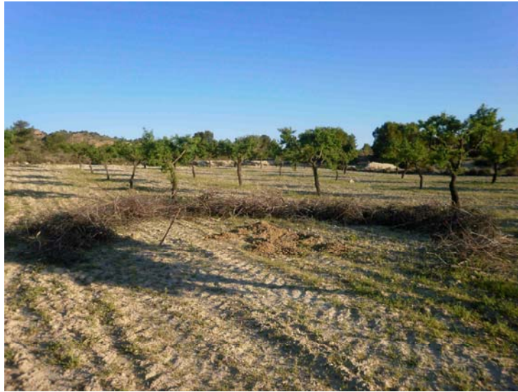
Restos de poda preparada para la quema

Recogida y apilado de poda de almendros. Se recogen y apilan todas las ramas resultantes de la poda, trasladándolas a los sitios elegidos para la quema.