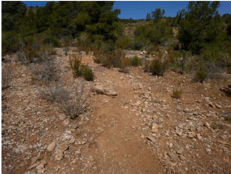
Tramo de senda utilizado para actividades de educación ambiental antes de ser repasado