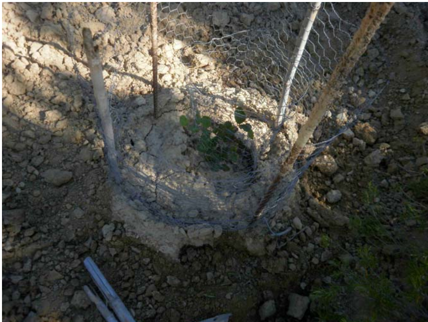
Plantación de algarrobo

Plantación de algarrobos. Se plantan algunos algarrobos rodeando la explanada donde se realizan las actividades de educación ambiental.