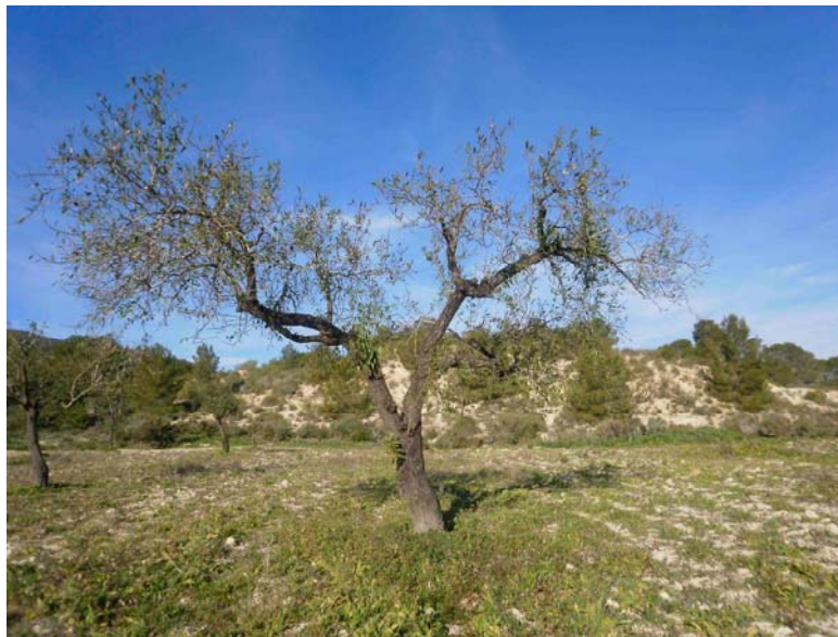
Almendo antes de la poda

En algunos árboles se eliminan ramas viejas atacadas por los taladradores, reponiéndose donde es posible por otras nuevas ramas jóvenes de repuesto.