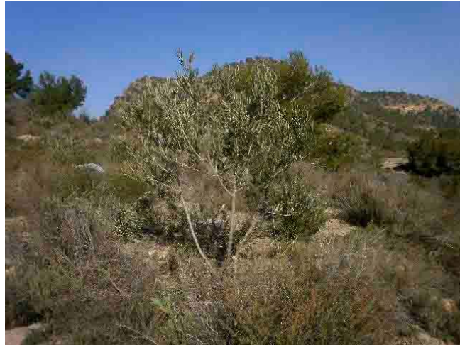
Seleccionadas ramas principales y despeje de brotes sobrantes