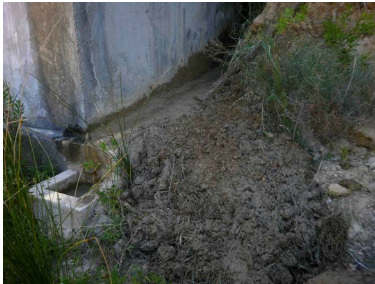
Parte de la tierra retirada

Limpieza lateral dealjibe. Se retira toda la tierra desprendida en el lateral del aljibe por donde se realiza el suministro de agua a las balsas con el fin de aprovechar todo el remanente de la fuga del aljibe para el llenado de estas.