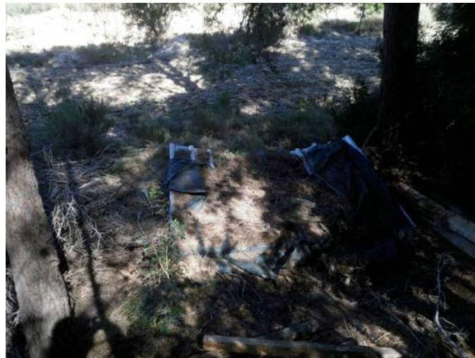
Restos de puestos de caza diseminados por la finca

Limpieza de basura. Se retiran restos agrícolas como plásticos y mangueras en desuso, y gran cantidad de materiales varios.