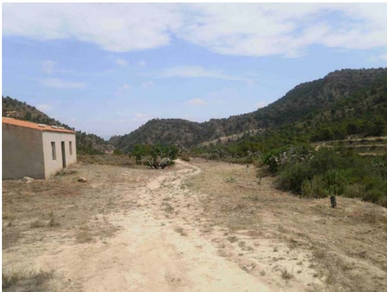
Alrededores de la casa después del desbrozado

Limpieza de basura. Se retiran plásticos, mangueras, bidones, escombros, maderas y vidrios acumulados en la cercanía de la casa.