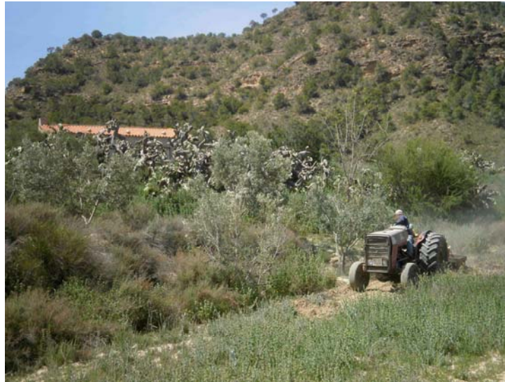
Labranza con cultivador

Labranza . Se labra la totalidad de la zona agrícola de la finca con gran dificultad por la alta densidad de vegetación debido al abandono de esta actividad durante dos años. La labranza se realiza con cultivador a una profundidad de unos 30 a 40 cm.