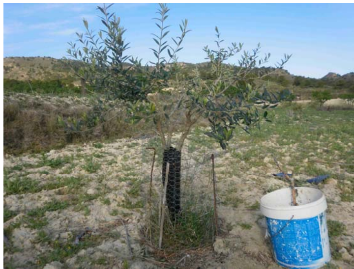
Olivo joven podado y protegido con malla, plástico y mezcla protectora de heridas

Poda de algarrobos y olivos plantados en el año 2010. Se realiza una poda de formación de ramas principales tras el pinzado del anterior año. Se embadurnan los troncos y ramas con arcilla y ceniza para cicatrizar las heridas causadas por los roedores.