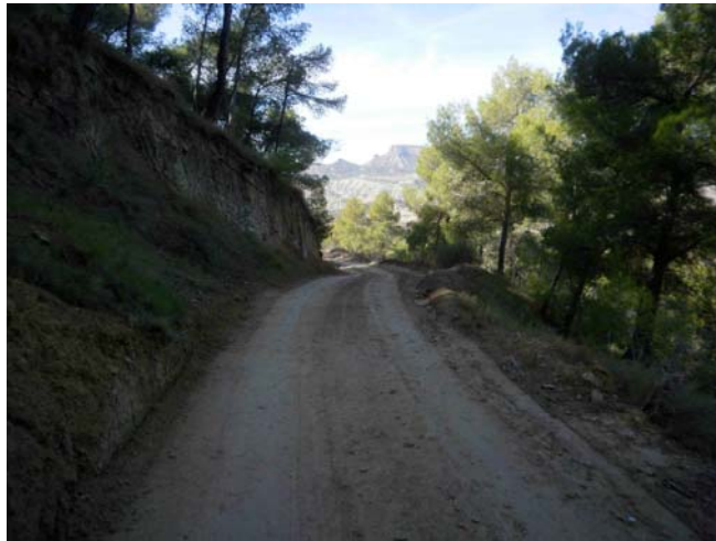
Camino recién trajillado

Retirada puestos de caza. Se desmontan puestos de caza para su retirada de la finca.